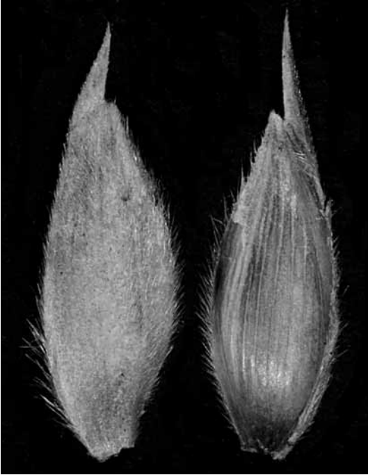
Abb. 6. Triticum turanicum 'Kamut'. Breiterer Teil der Hüllspelze von außen (links) und von innen (rechts) mit 8–10 Längsnerven. – Länge, ohne Granne, 11,5 bzw. 11,0 mm. – Saatgut wie Abb. 3.

Weizen verwendet worden ist; aber Verwenden von Namen in erweitertem oder eingegengtem Sinne ist ja auch bei wiss. Namen gang und gäbe und daher wohl kein Argument zugunsten einer Ablehnung. – Kamut als empfohlenen Namen für T. turgidum (= T. turgidum subsp. turgidum ) voranzustellen, ist unmöglich, dafür kommt am besten Rauh-Weizen, allenfalls noch Englischer Weizen, in Frage. Kamut gehört zu T. turanicum = T. turgidum subsp. turanicum (in der Flora nicht enthalten), dafür empfehlen sich als deutsche Namen am besten Khorassan-Weizen, allenfalls auch noch Orientalischer Weizen (Abb. 3–6); Kamut ® ist ein geschütztes, eingetragenes Warenzeichen für die Sorte QK-77 (vgl. < http://www.kamut.com/ >) und daher als Name für ein botanisches Taxon über der Rangstufe der Sorte nicht geeignet.