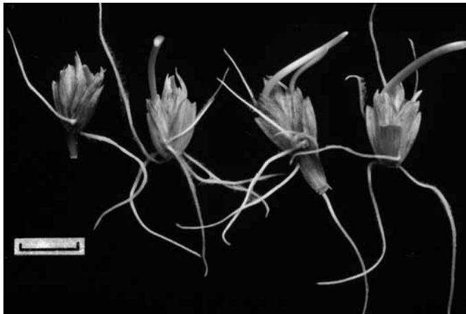
Abb. 2. Triticum spelta , 2 Ährchen Keilty, 2 Ährchen Faßtyp. – [Kulturpflanzenmerkmal: Reduktion des Keimverzuges, beide Körner eines Ährchens keimen ungefähr gleichzeitig]. – Meßstrich 1 cm. – Saatgut wie Abb. 1.