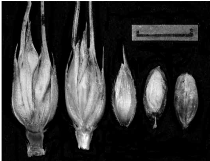
Abb. 5. Triticum turanicum 'Kamut', von links nach rechts: Ährchen abaxial, Ährchen adaxial, Hüllspelze von innen (breiterer Teil mit 8–10 Längsnerven), Korn aus der unteren Blüte (abaxial = Deckspelzenseite) und aus der oberen Blüte (adaxial = Vorspelzenseite) eines Ährchens. – Maßstrich 1 cm. – Ährenachse künstlich zerteilt, Saatgut wie Abb. 3.