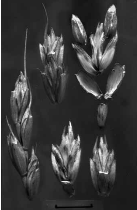
Abb. 1. Triticum spelta , Ährenbruchstücke und einzelne Ährchen. Rechts oben ein Ährchen zerlegt, Mitte unten Ährchen plus Ährenachsenbruchstück vom Keilty, rechts unten detto, Mitte, Faßtyp. – Meßstrich 1 cm. – Saatgut vom Landwirtschaftlichen Versuchszentrum Wies/Steiermark, erhalten 1985.