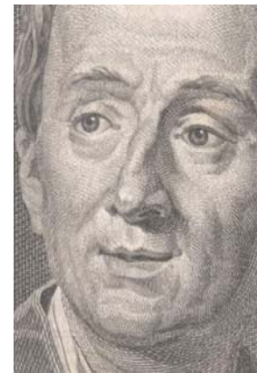
Denis Diderot (1713-1784)

Vorurteile oder Klischees, wie die Auffassung von der „Französinn“ (oben) im Krünitz , Lebensumstände, wie umseitig die Anmerkung über das Reisen im Frauenzimmer-Lexikon oder die Gesellschaftskritik der Encyclopédie werden aus erster Hand vermittelt, meist von einem gewissen Standpunkt und mit einer bestimmten Absicht. So ist jede Enzyklopädie auch Spiegel der Gesellschaft ihrer Zeit und Vergangenheit. Enzyklopädien wecken die latente Lust, Widersprüche zu finden und in ihnen den (un)kritischen Geist der Autoren. Manche von ihnen gingen für ihre Anschauung ins Gefängnis. Sie kritisierten nicht aus mutwilliger Anarchie, sondern standen zu ihrer rationalen Wahrnehmung der Wissenschaften, in der Kirche und Religion selten Platz finden.