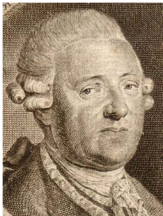
Johann Georg Krünitz (1728 - 1796)

Z.B. Französinn , eine Person weibliches Geschlechtes, welche aus Frankreich gebürtig ist ... (auch die Benennung ... Mamsell, welche vermögende Leute zum Unterrichte ihrer Kinder ... in allerley Frauenzimmer-Wissenschaften, und zu deren Erziehung in den Sitten und Thorheiten der französischen Nation, in ihren Häusern zu halten pflegen ... Man hat in der Wahl der Französinnen zwo Klippen zu vermeiden ... Sind sie zu jung, so lodert die Liebesflammen in ihnen; sie suchen sich einen Gegenstand ihrer Lüste im Hause ... Sind sie zu alt ... so sind sie herrsch- und zanksüchtig ... Das Französische selbst ist gestümpert, die prompten Einfälle vielleicht so gefährlich, als das Lesen der Romanen. Eine tugendhafte Prediger- oder andere Wittve ... würde ich allemahl weit vorziehen ...