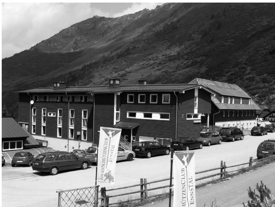
UNI Sportheim Planneralm